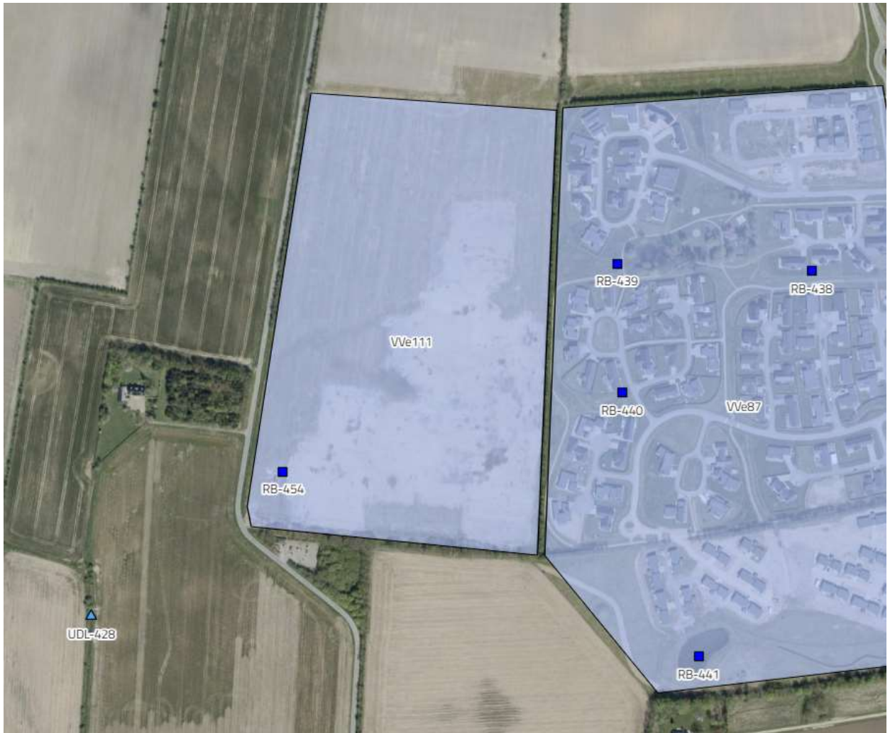
Kloakopland VVe111 med placering af udløb (UDL-428) og regnvandsbassin (RB-454)